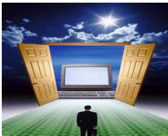
شکل ۲. الهیات تکنولوژی

یا شیوه‌های بیانِ دین و «ایمان» در آن گونه محیط‌هاست؛ یا استعاره‌هایی است که چنان محیطی می‌تواند دربارهٔ خداوند فراهم آورد. شکل ۲ «تأثیری را که الهیات بر تکنولوژی می‌گذارد، نشان می‌دهد، در واقع به منظور کمک به تمایز بخشیدنِ «الهیات تکنولوژی» از الهیاتِ سایر، آنجا که «الهیات و تکنولوژی» با الهیات متعارف در یک ردیف قرار می‌گیرند. همان‌طور که به وسیلهٔ مسیح و صلیب بازنمایی شدند و به تفوقِ حاکمِ عالی مقامِ تداوم بخشیدند.