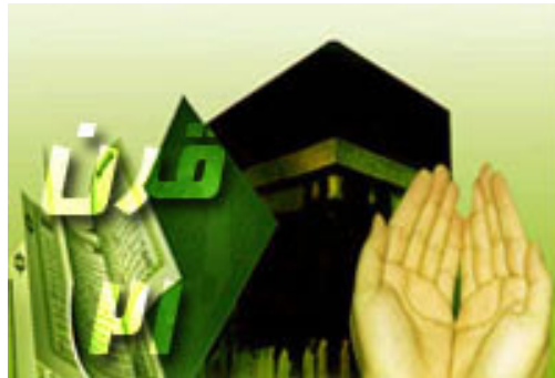
شکل ۱. تکنولوژی با دین در قرن بیست و یکم مواجه می‌شود.

می‌تواند از بنیانی وسیع‌تر بهره‌مند شود. به عبارت دیگر، ما کارِ توأمانی را دربارهٔ اینکه چگونه هر یک می‌توانند به دیگری کمک نمایند، هویدا می‌سازیم. شکل یک به صورتِ مصوّر این همکاری تکنولوژی و دین را توضیح می‌دهد که متن حاضر آن را می‌کاود.